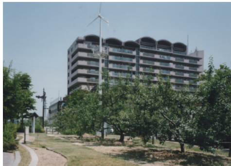
3 トップヒルズ本町