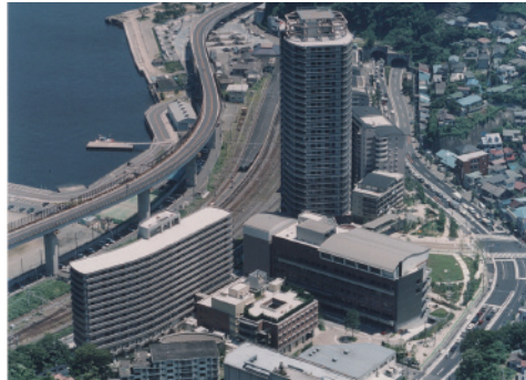
1 ウェルシティ横須賀