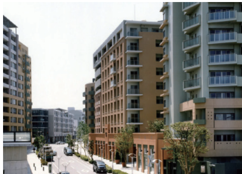
2 幕張ベイタウン・パティオス公園東の町