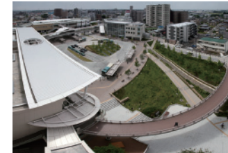
4 スカイテラス狭山