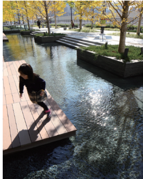
1 グランフロント大阪